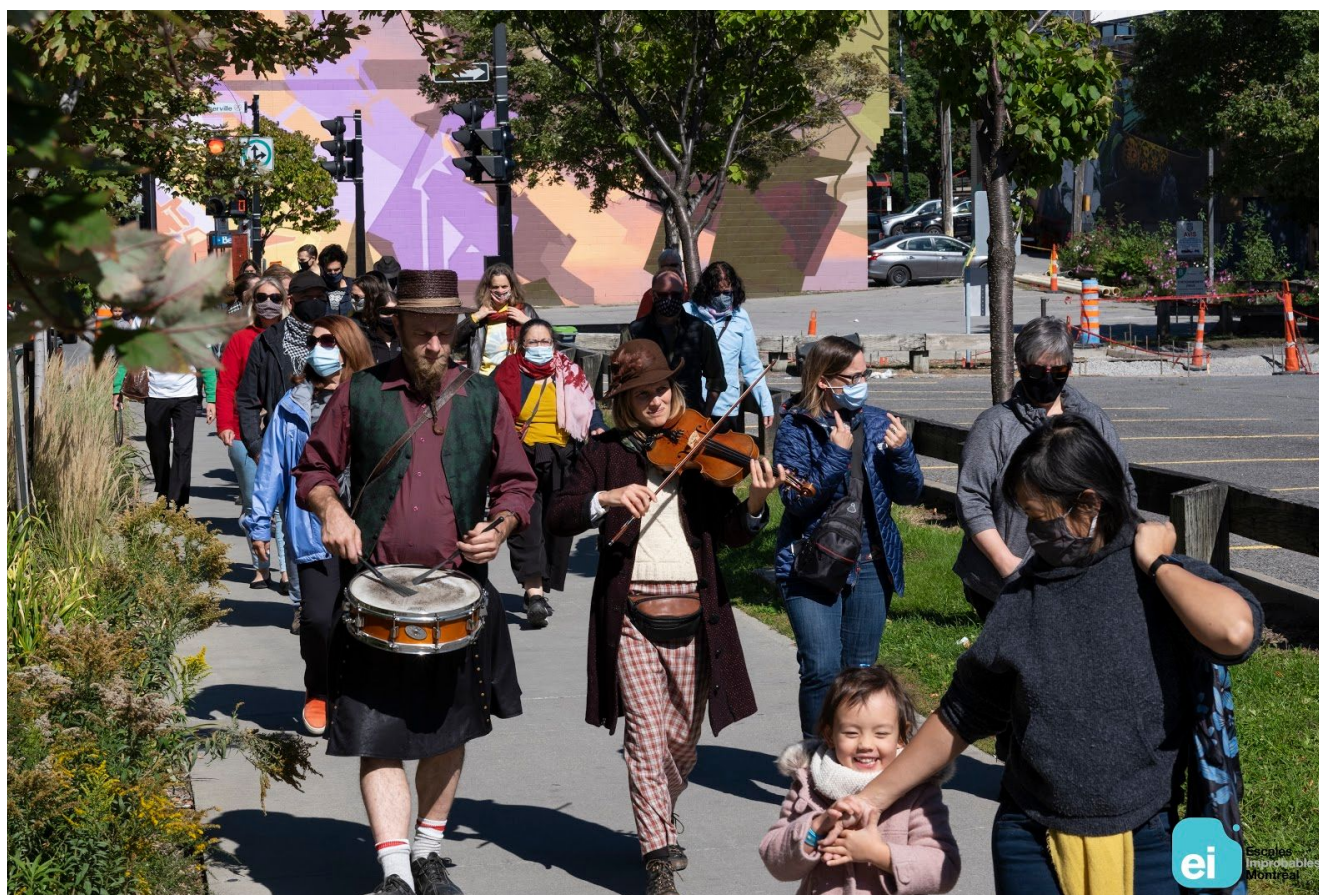
Déambulation lors des parcours des Explorateurs #3.