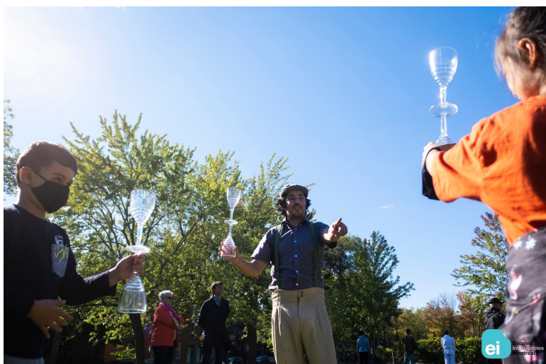
Parc Méderic-Martin, atelier d'initiation aux arts du cirque avec les artistes de Cirque Hors Piste