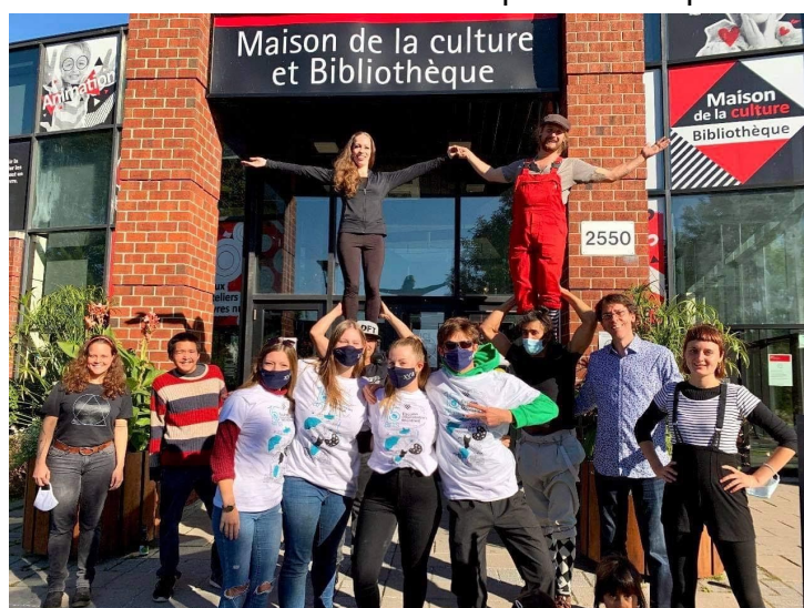
Bénévoles, membres de l'équipe des EIM et de Cirque Hors Piste à la conclusion des Explorateurs #3.

Cette expérience de propositions pluridisciplinaires (visites guidées sur le patrimoine et performances artistiques) a été une très belle réussite et atteste de l'excellente collaboration entre tous les acteurs. Nous envisageons de réitérer l'expérience en consolidant les points de croisement entre nos expertises respectives.