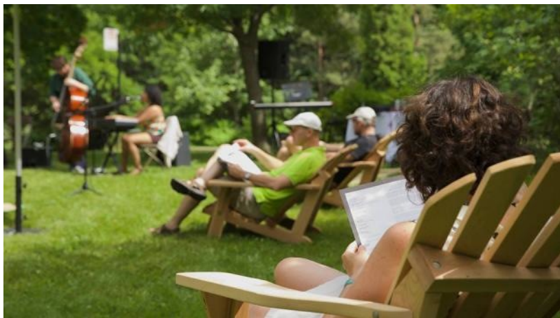
Les Siestes Musicales