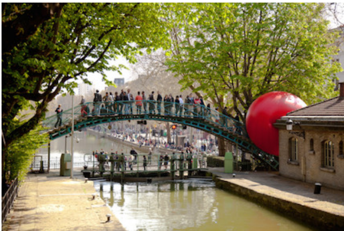
Kurt Perschke – RedBall

Pour Sylvie Teste, directrice artistique et générale des EIM, « En 2014, les EIM font peau neuve et se déploient sur de nouveaux terrains de jeux à travers le territoire de la métropole. Avec cette nouvelle déclinaison, les Montréalais curieux et les afficionados d'arts vivants étonnants seront au comble lors de cette édition qui met Montréal au cœur de sa programmation composée principalement de productions originales et de créations ».