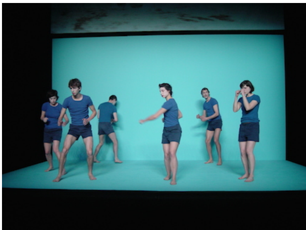
Loïc Touzé (compagnie ORO) – LOVE

Pour sa première venue au Canada, Loïc Touzé, chorégraphe français (compagnie ORO), apporte dans ses bagages deux projets atypiques : Autour de la table et LOVE. Autour de la table met en lumière les enjeux multiples liés au corps et vous invite... autour de la table ! À chaque table, une personne de Montréal, extérieure au milieu artistique et ayant développé un savoir particulier lié au geste, partage ses connaissances avec vous. Puis, changez de table et découvrez, à travers ces récits, les imaginaires contenus dans nos gestes. Avec LOVE , pièce chorégraphique insolite et inclassable, Loïc Touzé a créé un spectacle de danse qui se regarde comme un film. Entre cabaret et cinéma muet, il se pourrait que les codes de la danse contemporaine se trouvent un peu bousculés. Ce coup de projecteur sur Loïc Touzé est présenté en collaboration avec l'Agora de la danse.